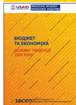
Бюджет та економіка: основні тенденції 2009 р.